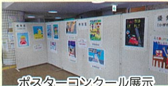
ポスターコンクール展示