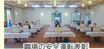
職場の安全運転表彰