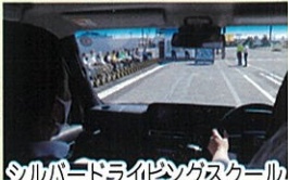
シルバードライビングスクール