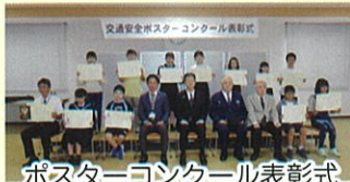
ポスターコンクール表彰式