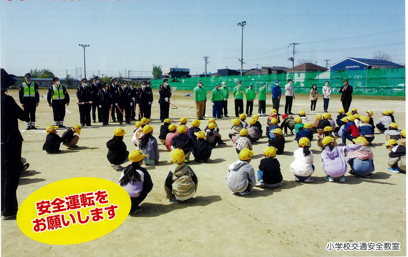
小学校交通安全教室