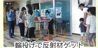
輪投げで反射材ゲット