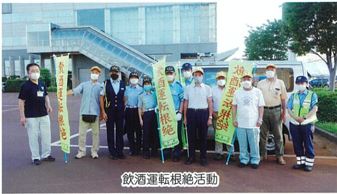
飲酒運転根絶活動