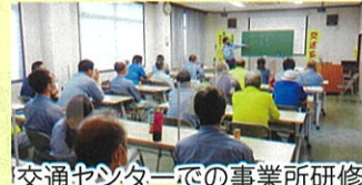
交通センターでの事業所研修