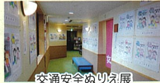
交通安全ぬりえ展