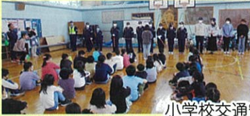
小学校交通安全教室