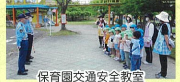
保育園交通安全教室