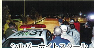
シルバーナイトスクール