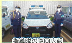
指導隊の巡回広報