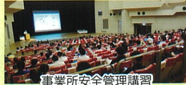
事業所安全管理講習