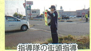
指導隊の街頭指導