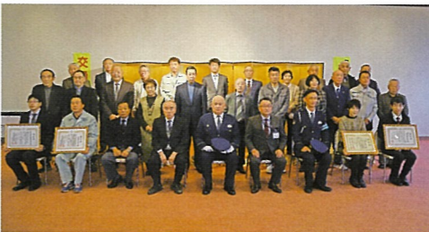
安全運転功労者等表彰