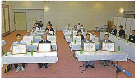
職場の安全運転表彰