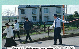
祭礼等での安全誘導