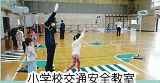
小学校交通安全教室