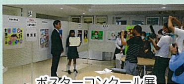
ポスターコンクール展