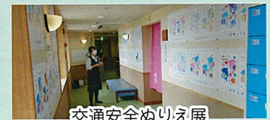
交通安全ぬりえ展