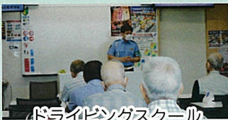
ドライビングスクール