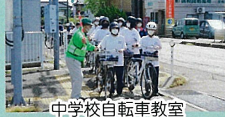
中学校自転車教室