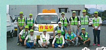
カーブミラー清掃