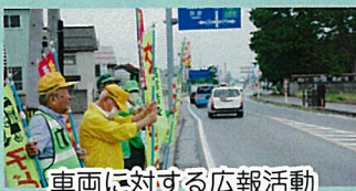
車両に対する広報活動