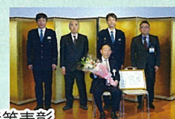
職場の安全運転表彰