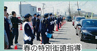
春の特別街頭指導