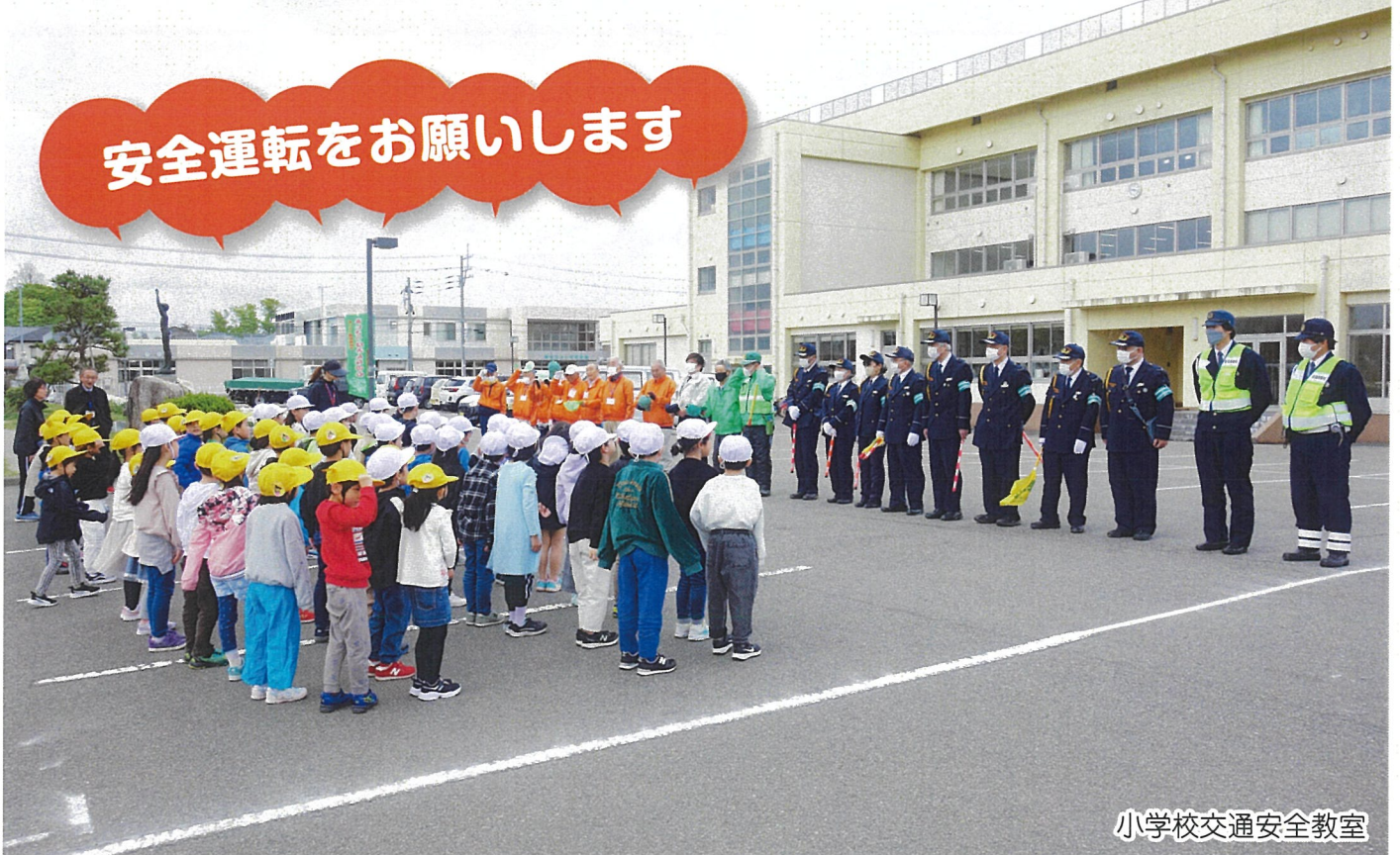
小学校交通安全教室