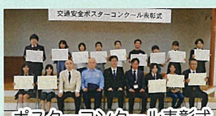
ポスターコンクール表彰式