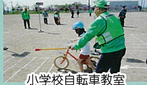
小学校自転車教室