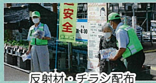
反射材・チラシ配布