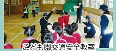
こども園交通安全教室